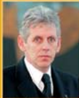
Guðmundur Baldvinsson útfararþjónusta