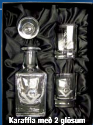
Karaffla með 2 glösum

Gjafavara - Gjafavara - Gjafavara - Gjafavara