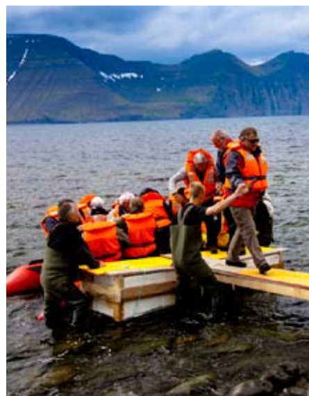
Gengið á land.

Að lokinni bróðurmáltíð voru haldnar stuttar tölur af bæði íslenskum og norskum bræðrum. Var það hin besta skemmtun og allir orðnir mjög