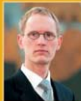
Frimann Andrésson útfararþjónusta