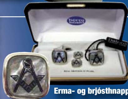
Erma- og brjósthnappar