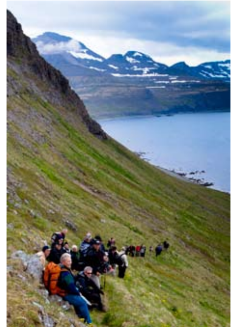
Menn nutu veðurblíðunnar og útsýnisins á göngunni.