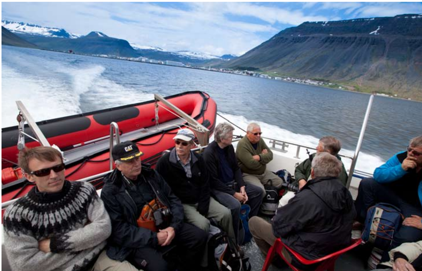
Sigt á leiðis til Hornvíkur frá Ísafirði.