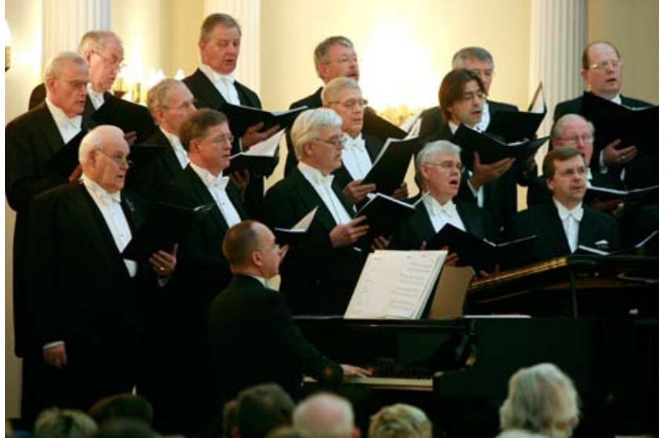
Starf Frímúrarakórsins er kraftmikið.

Þann 30. janúar nk. verður Frímúrarakórinn 20 ára. Af því tilefni ætla kórinn að halda veglega tónleika í vor. Á dagskrá verða öll helstu lög sem