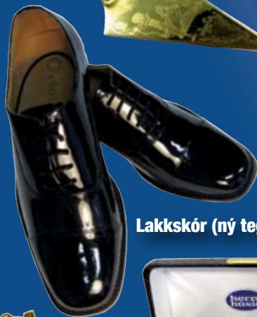
Lakkskór (ný tegund)