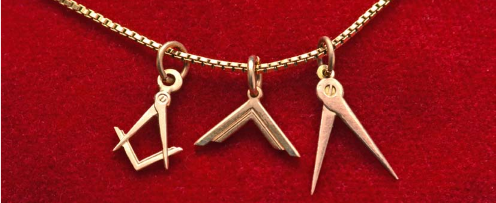
Systragjöf frá um 1990, 14 kt. gull. Frímúraramerkið, hornmát og hringfari.