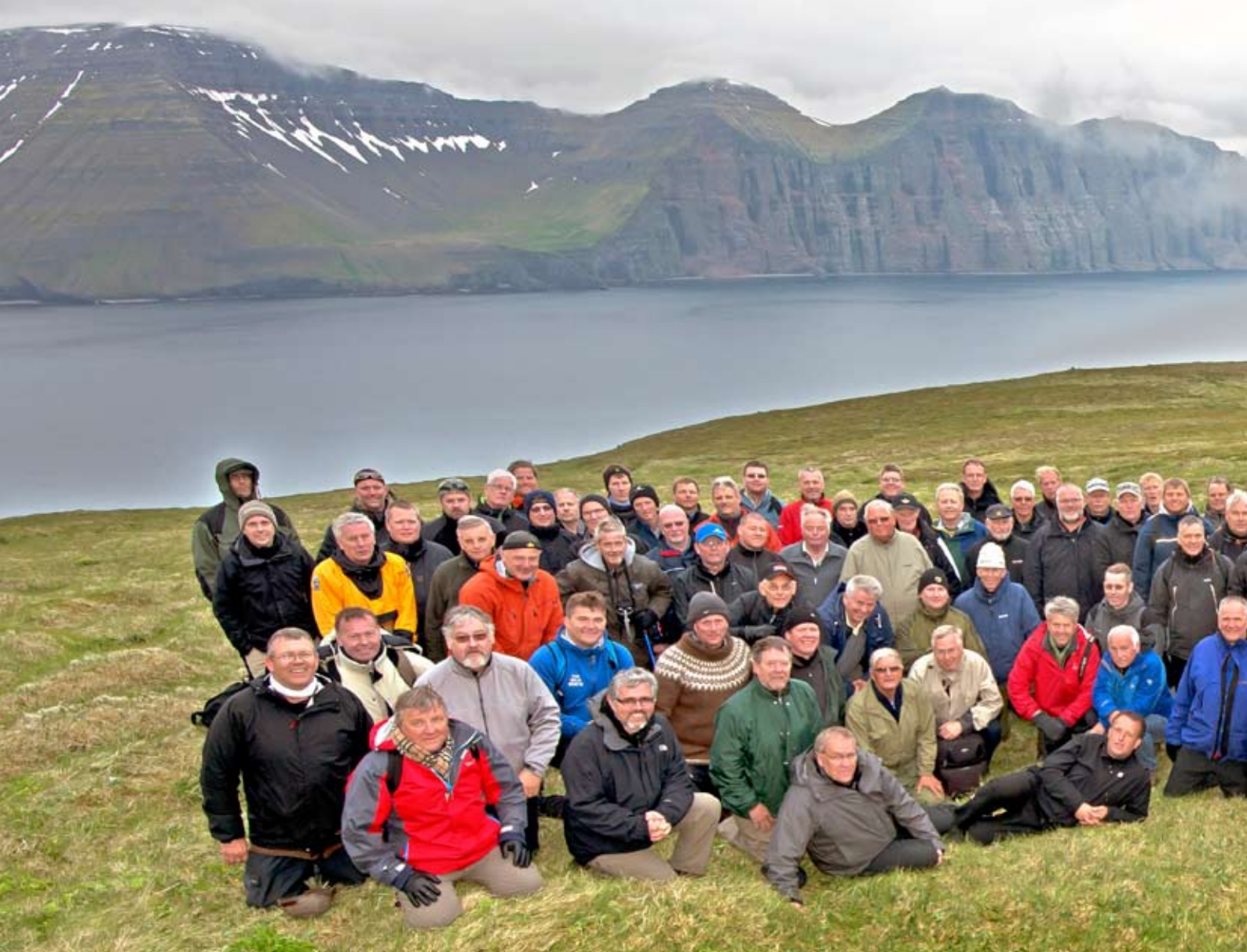
Fjölmennur hópur frímúrara tók þátt í Jónsmessufundinum á Hornbjargi.

inguna á þeim góðviðrisdegi tók náttúran svo undir við fundarhaldið, þegar gríðarmikil bergfylla hrundi úr Hælavíkurbjargi, hinu megin Hornvíkur, svo undir tók í fjöllunum. Sjást enn greinileg merki þessa berghruns, enda er fyllan feikistór.