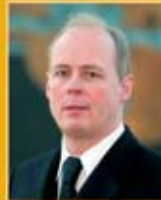
Ellert Ingason útfararþjónusta