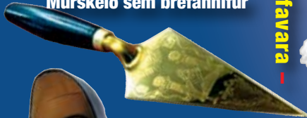
Múrskeið sem bréfahnífur

Gjafavara - Gjafavara - Gjafavara - Gjafavara