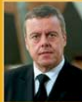
Þorsteinn Elísson útfararþjónusta