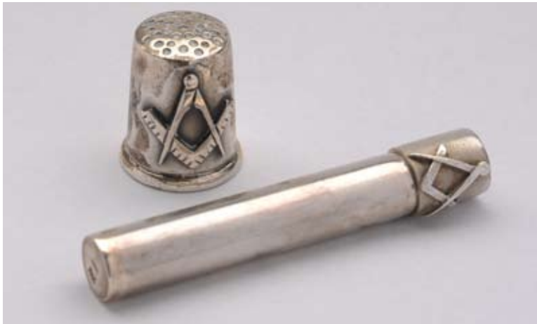
Fingurbjörg og nálahús, hugsanlega frá 1950 eða þar um bil. Bræður hafa kannski verið að hugsa um „praktísku“ hliðina í þá daga.

Síðameistarar stúknanna fengu oftast það verkefni að hugsa fyrir systragjöf og var þá oft ansi mikið að gera.