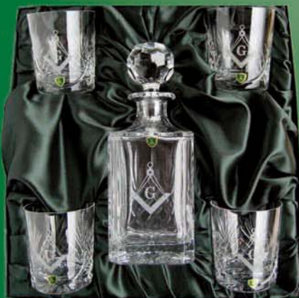
Karaffla með 4 glösum