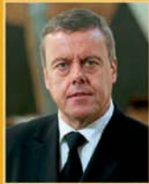
Þorsteinn Elísson útfararþjónusta