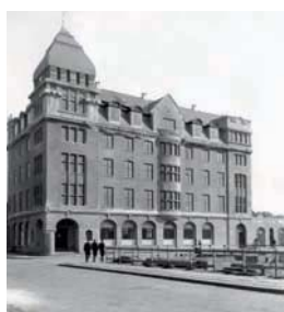
Forsíðumyndin er af húsi Nathan & Olsen að Austurstræti 16 þar sem síðar var Reykjavíkrapótek. Á efstu hæð hússins hafði Frímúrarareglan á Íslandi sitt fyrsta aðsetur.