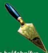
Múrskeið sem bréfa hnifur