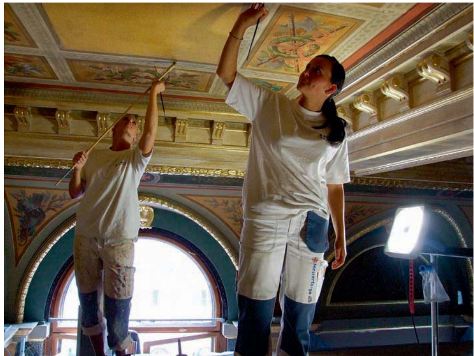
Unnið að viðgerð armigersalar sumarið 2008.

ustu áratugi minnst hans eflaust sem salar í dökkum litum – rauðbrúnir veggir og þungar, brúnar hurðir. Nú hafa upprunalegir litir verið endurnýjaðir, í sal sem nú er mun léttara yfir í ljósari litum, ásamt endurnýjuðum súlum og viðgerðum sem margir fremstu iðnaðarmenn Evrópu hafa tekið þátt í. Að sjá salinn endurnýjaðan í upprunalegri mynd er heim-sóknarinnar virði.