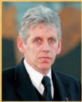
Guðmundur Baldvinsson útfararþjónusta