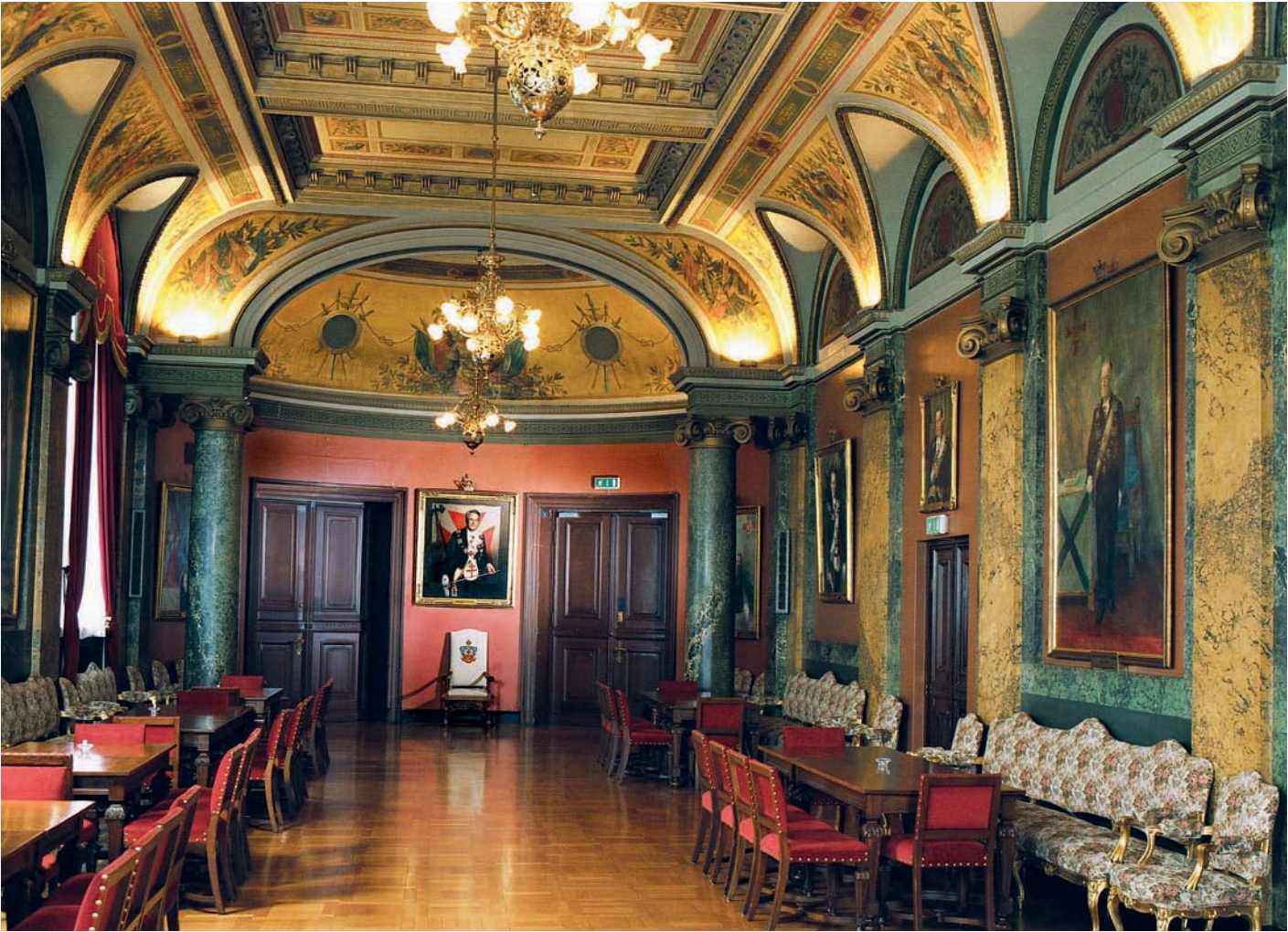
Endurnýjaður armigersalur norska Frímúrararhússins.