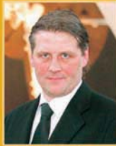
Svafar Magnússon útfararþjónusta