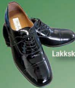
Lakkskór (ný tegund)