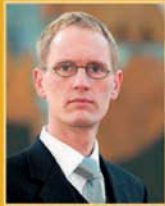
Frimann Andrésson útfararþjónusta