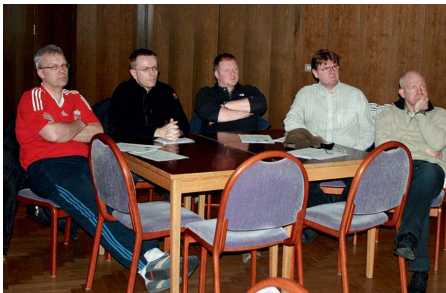
Frá endurlífgunarnámskeiði fyrir siðameistara.