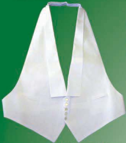
Hátiðavesti (5 hnappa)