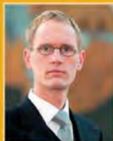
Frímarr Andrésson útfararþjónusta