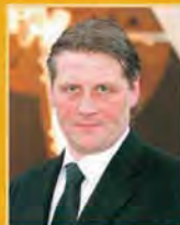
Svafar Magnússon útfararþjónusta