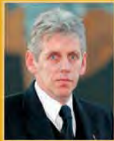
Guðmundur Baldvinsson útfararþjónusta