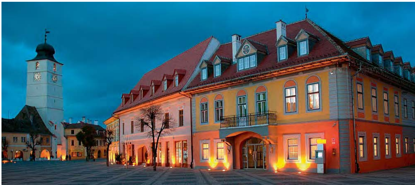
Þrjár þjóðir og fjögur trúfélög skópu grundvöll fjölþætts samfélags. Sibiu/Hermannstadt eins og hún er í dag.