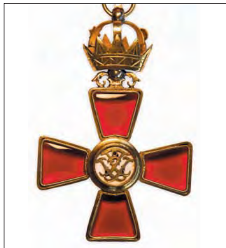
R&K kross Frímúrarareglunnar. Hann ber fangamark Reglunnar í spegilskrift FÍ (Frímúrarareglan á Íslandi). Ofan á efri hluta krossins er opin gyllt kóróna. R&K kross Frímúrarareglunnar er ekki opinber orða.